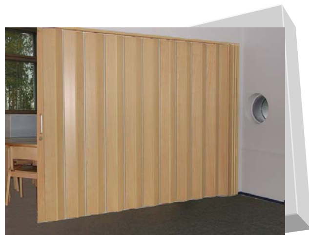
PTO-330 drzwi harmonijkowe panelowe podwójne Buk