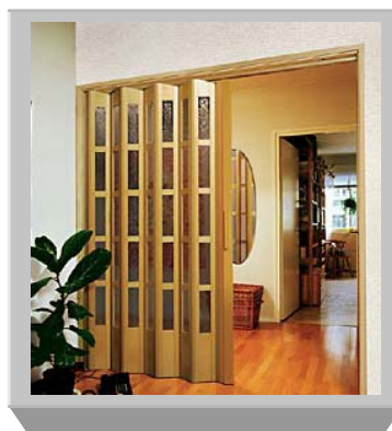
PTO-145 KATEDRAL Fornir - buk