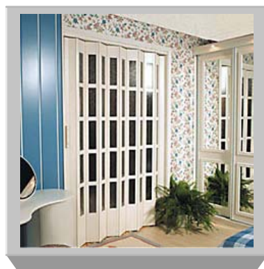
PTO-145 witrażowe Powłoka malarska biała