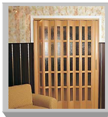
PTO-145 witrażowe Fornir - buk