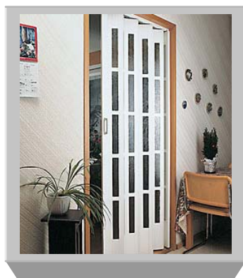
PTO-145 witrażowe Melamina biała