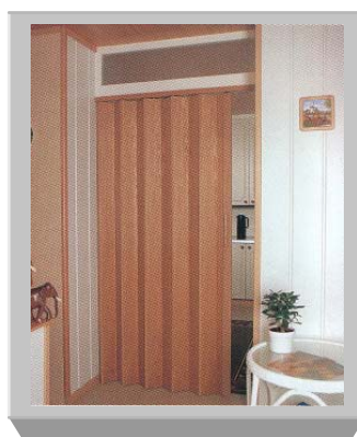
PTO-110 Fornir - dąb