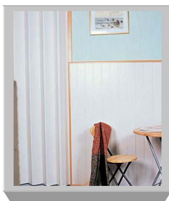
PTO-110 Melamina - biały jesion